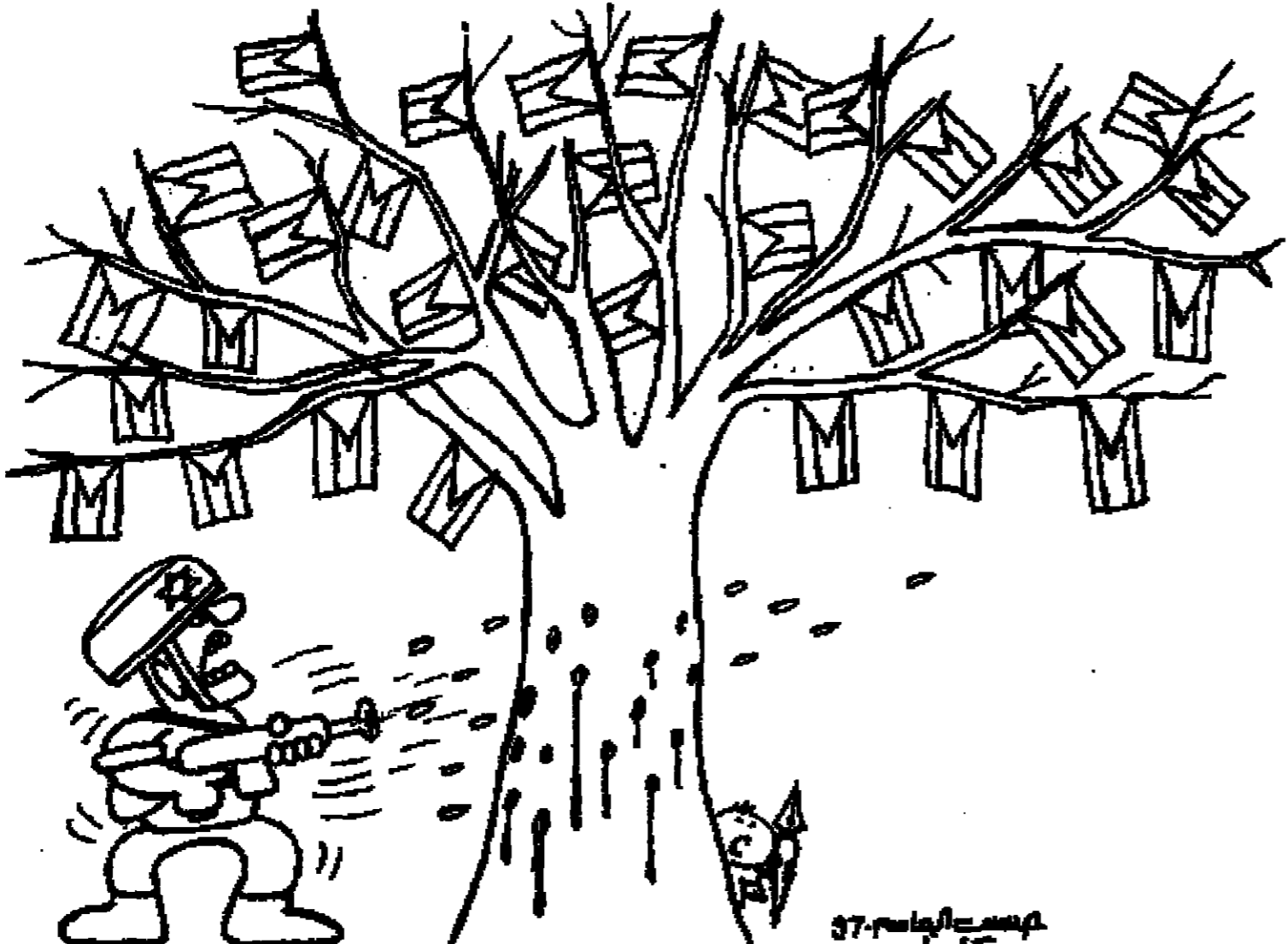
مهندس الجاهل 37

قرار دول الاتحاد الأوروبي الذي صدر أمس الأول بإعادة السفارة إلى طهران يؤكد للمرة الألف أن المصالح التجارية تتفوق على كل قضايا حقوق الإنسان والديمقراطية بالنسبة إلى الحكومات الغربية. فيما قبل من ثلاثة أسابيع من سحب الدول الأوروبية لسفرائها في طهران احتجاجا على تورط إيراني مزوم في اغتيال أربعة معارضين لكرام ملها جاء في حكم صادر عن محكمة ألمانية تراجمت هذه الدول من قرارها، وبدأت توفد مندوبي مبيعاتها وممثلي شركاتها إلى العاصمة الإيرانية بشما عن صفقات تجارية. وقد كان واضحا، ومنذ اللحظة الأولى التي صدر فيها الحكم في قضية ميكونسو الشهيرة، أن الحكومة الألمانية الشريكة الأكبر لأوروبا، لم تغير جادة في تحريكها لخروج أي عقوبات على الحكومة الإيرانية، فقد ظلت على عهد السنوات الثلاث ونصف السنة من عمر القضية في الحكم، تبحث عن صيغة لتجاوز ماء الوجه، ووجدتها عندما اتفقت مع الحكومة في طهران على عدم توجيه أي اتهام لرئيس الجمهورية، وأمامها الرuchi بالاسم في التورط بالقضية، والتقدم بطلب لاستدعائه للمحاكمة في ألمانيا. وسجل للقيادة الإيرانية صلابتها في هذه المسألة، ونجاحها في املاء ارادتها على الدول الأوروبية، وهو نجاح عائد إلى العسفة بطابع هذه الدول، ومدى حرصها على رخاء شعوبها من خلال تقديم الاقتصاد وفرص العمل على أي شيء آخر. فليس صفة أن إيران رفضت عودة سفيري ألمانيا والمنازلة لأنها تشعير أنها في موقف قوي، يؤهلها لنفرض ارادتها، واستخدام كل ما في جعبتها من أوراق لتلحق حكومتها بالبلدين ما استحققتان من مؤوس. لنا عود اغتيال المعارضين السياسيين، الإيرانيين كانوا أو غرباء، وتدين كل هذه الأساليب التي تتنافى